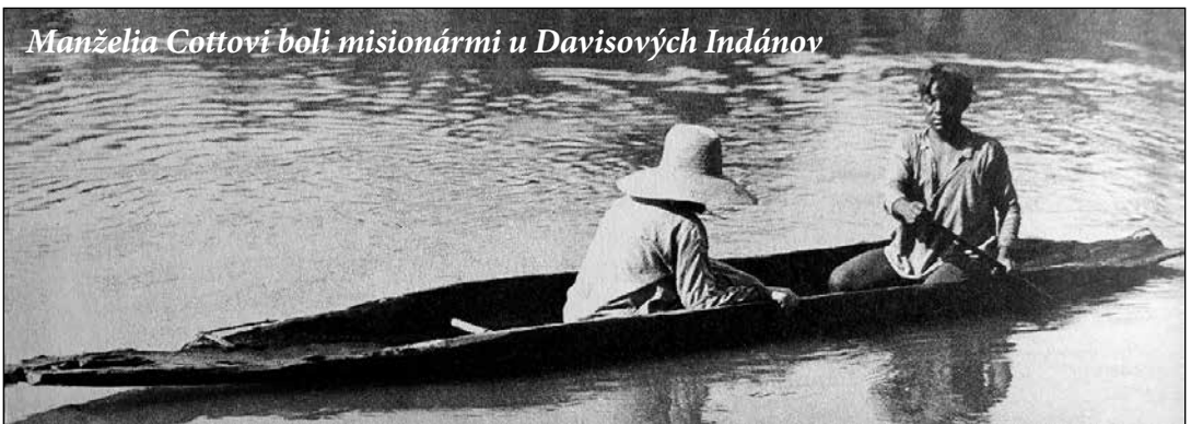
Manželia Cottovi boli misionármi u Davisových Indánov

Premýšľaj o tom, koho vo svojom okolí môžeš pozvať napríklad na tábor, schôdzku Pathfinder alebo na bohoslužbu do zboru. Začni sa modliť za konkrétneho človeka, aby ti dal Boh príležitosť povedať mu o jeho láske. Každé ráno sa modli za príležitosti byť požehnaním pre iných, za to, aby ňa Boh použil podľa svojej vôle.